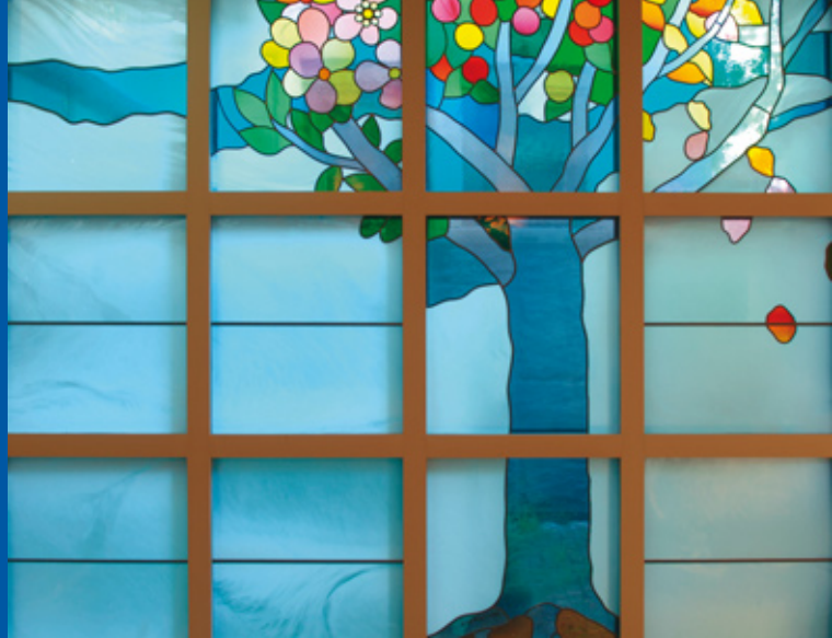
«Lebensbaum» – Glasfenster in der Spitalkirche